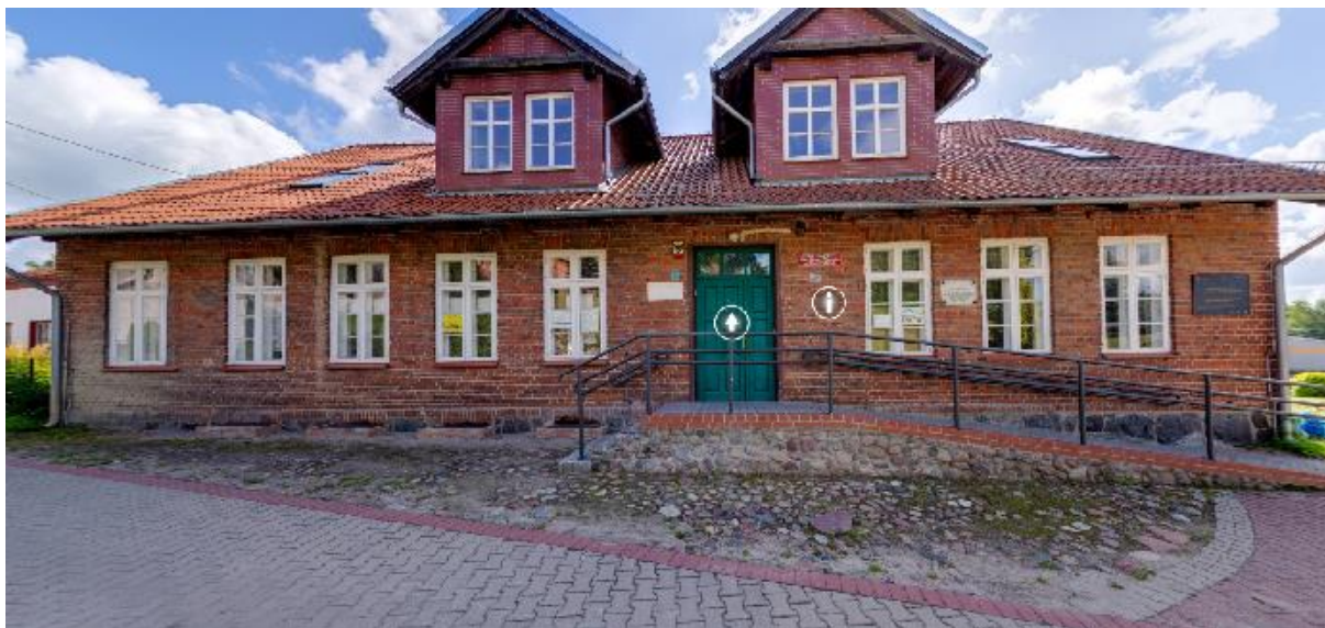
Centrum Dziedzictwa Kulturowego w Brąswaldzie z Izbą Pamięci Marii Zientary-Malewskiej

kulturowe. W ramach realizacji projektu wykonany został również m.in. wirtualny spacer po Brąswaldzie (dostępny na stronie internetowej gminy Dywity) zawierający najważniejsze zabytki i miejsca we wsi.