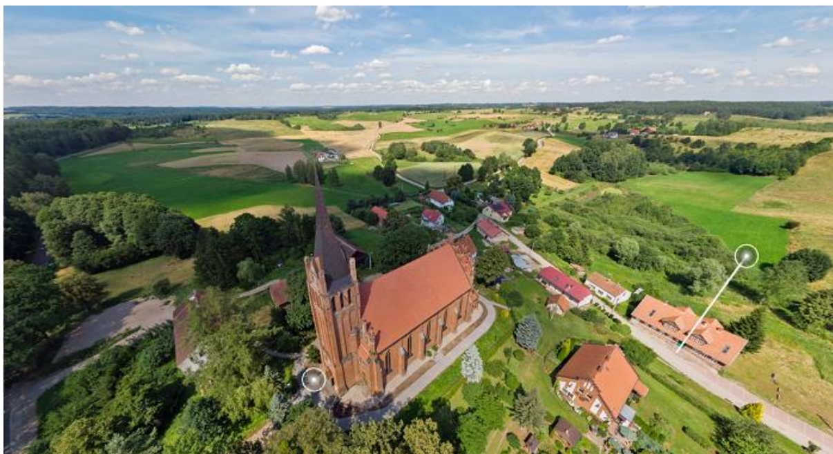
Kościół w Brąswaldzie z lotu ptaka