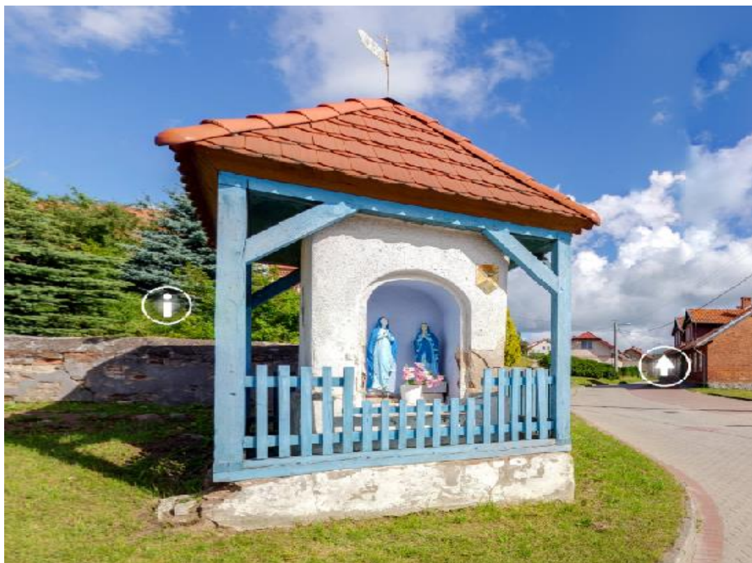
Zabytkowa kapliczka z 1786 r. w centrum miejscowości Brąswald