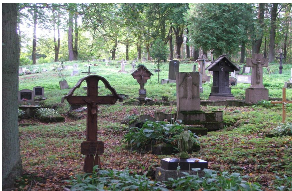
Cmentarz parafialny

Innym elementem sakralnym jest cmentarz parafialny , stosunkowo dobrze zachowany z licznymi, unikalnymi, zabytkowymi grobami (między innymi ks. Barczewskiego), przykładami sztuki sepulkralnej. Niewielka nekropolia otoczona jest wysokimi, starymi drzewami.