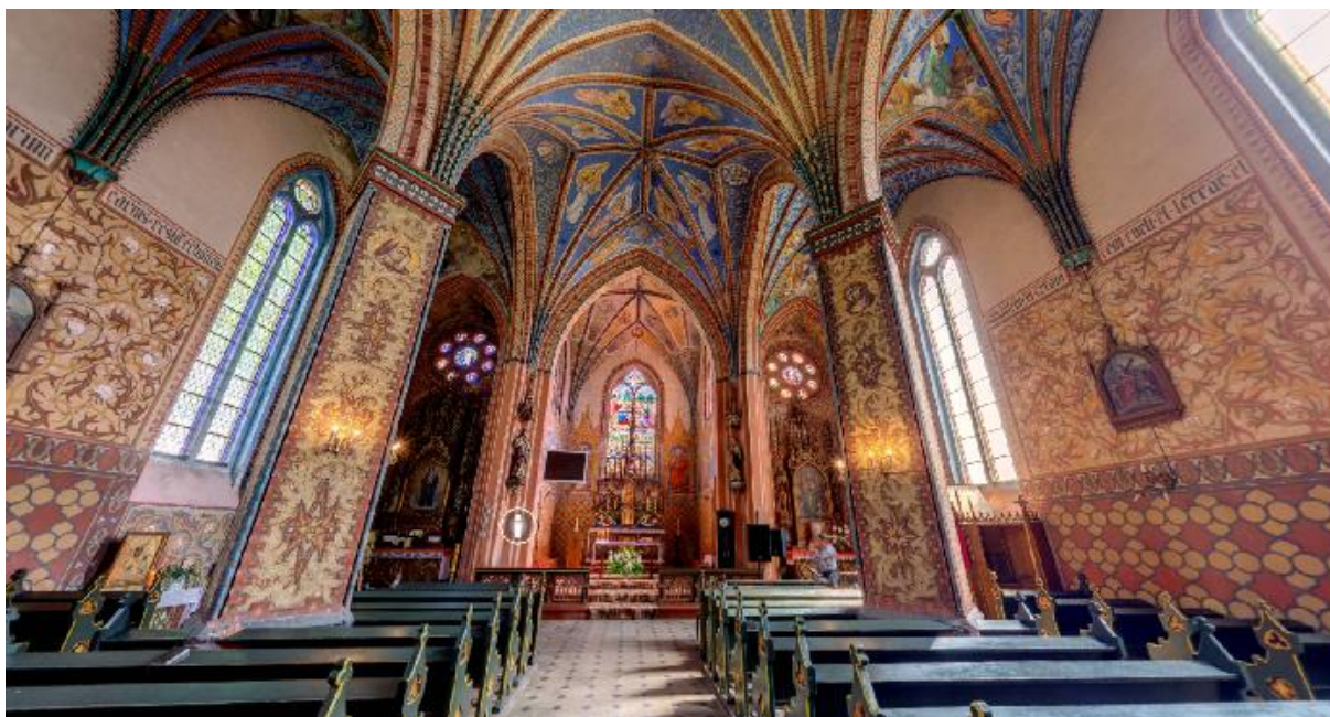
Wnętrze zabytkowego kościoła p.w. św. Katarzyny w Brąswaldzie z 1897 r.