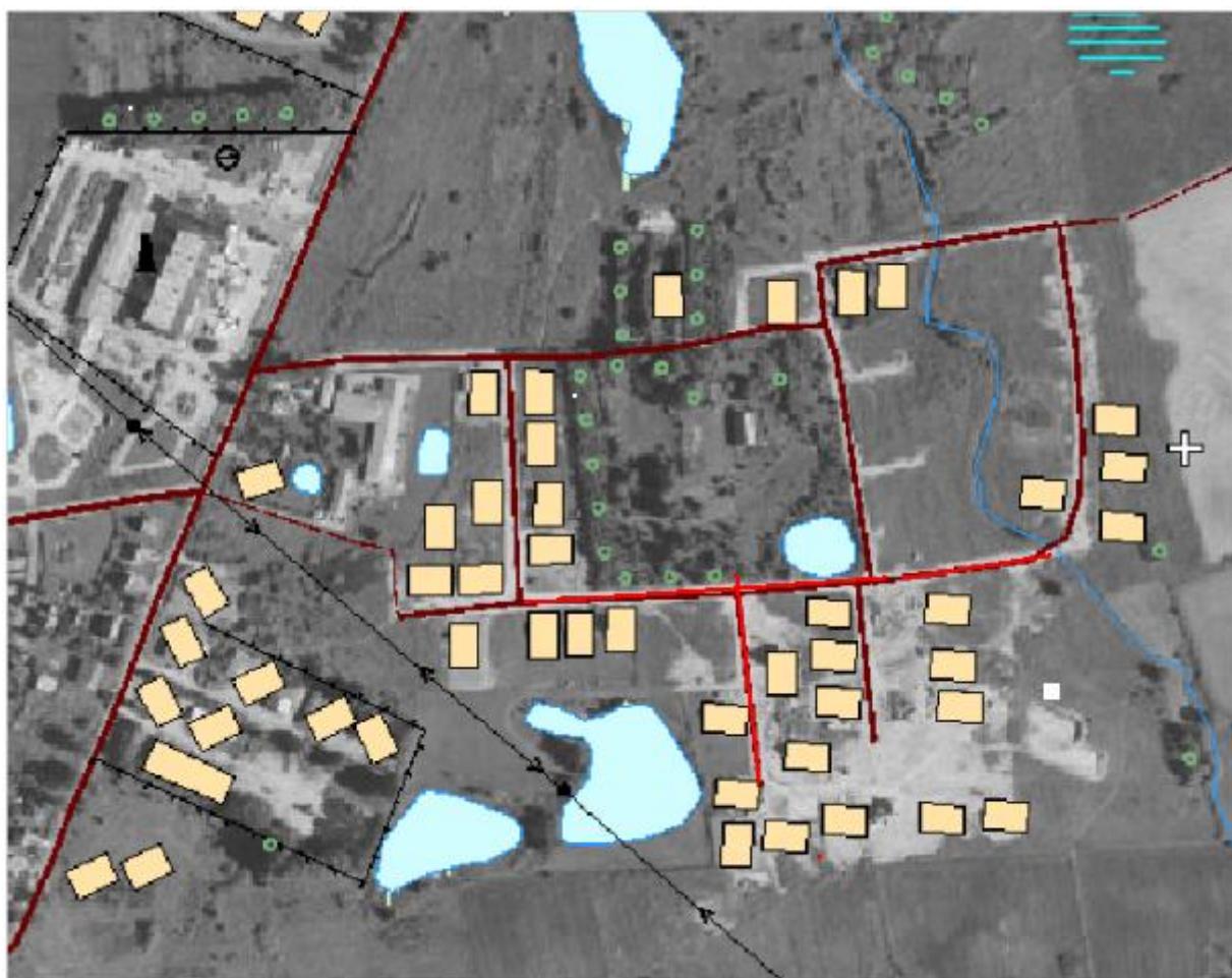
Zaprojektowana deszczówka zaznaczona kolorem czerwonym