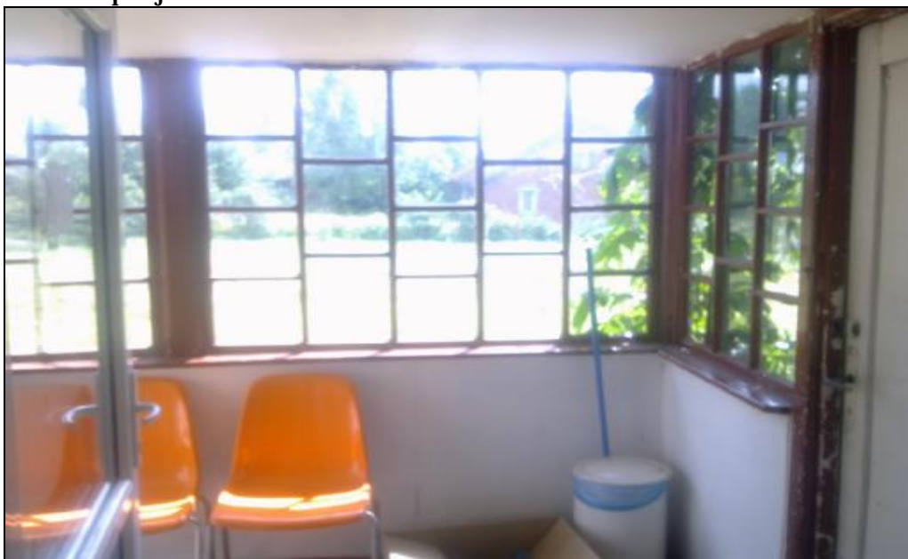
Istniejący wiatrołap- do rozebrania.