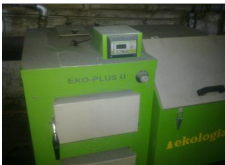
Fot. Kocioł zamontowany w ubiegłym roku.

Istnieje konieczność wykonania zmian w dokumentacji projektowej ze względu na rezygnację Zamawiającego z drugiego kotła. Zmian w dokumentacji dokona Zamawiający. Wynagrodzenie Wykonawcy zostanie wypłacone na podstawie kosztorysu powykonawczego.