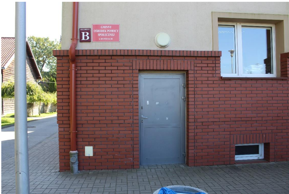
Wejście do części B Urzędu Gminy.

Wejście do części B jest od ul. Spółdzielczej.