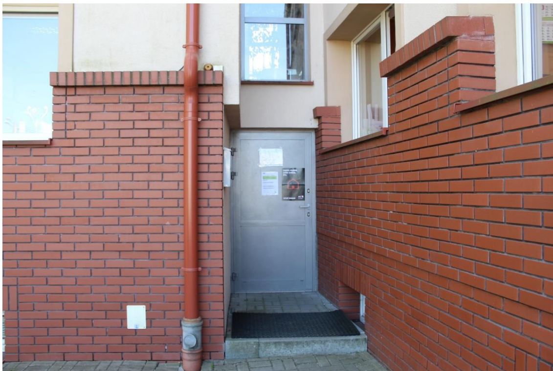
Wejście boczne do części A Urzędu Gminy.

Drugie wejście do części A jest od ul. Spółdzielczej.