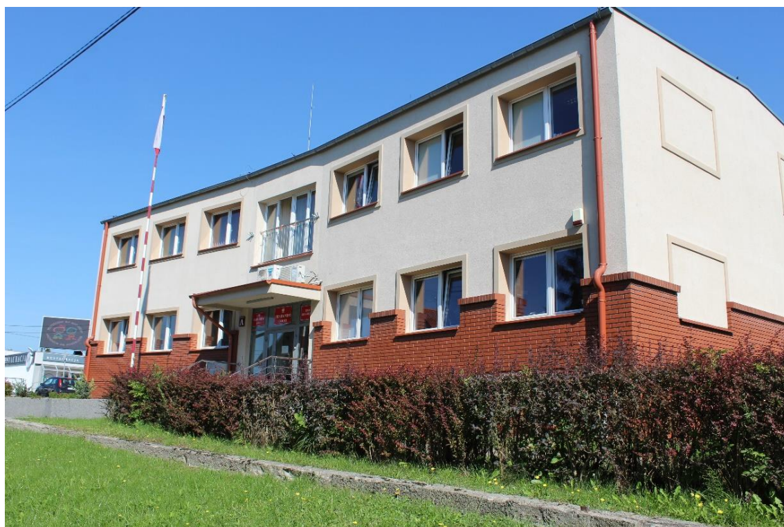
Budynek Urzędu Gminy (widok od strony ulicy Olsztyńskiej).

Urząd Gminy w Dywitach, czyli w skrócie Urząd, znajduje się przy ul. Olsztyńskiej 32 w Dywitach.