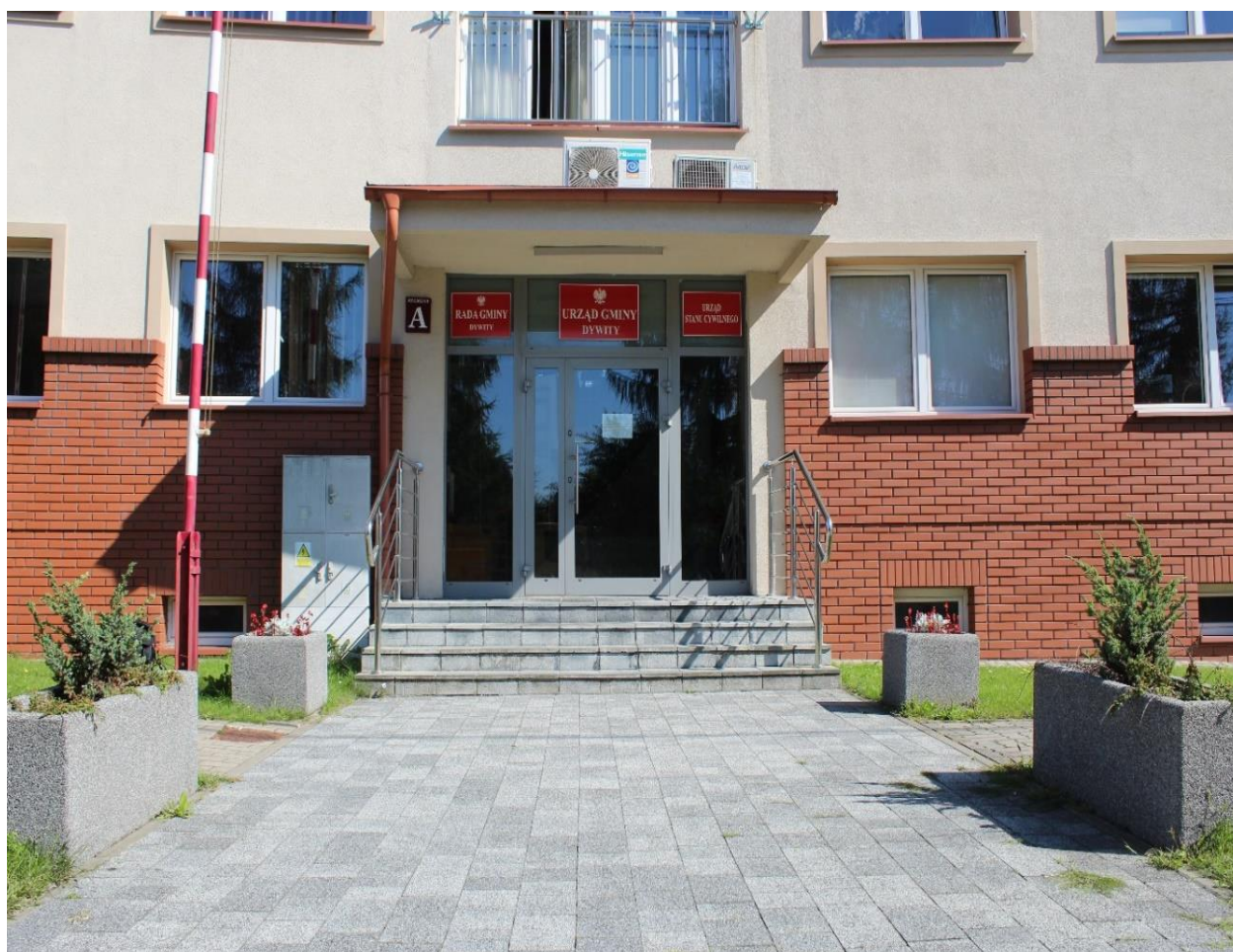
Wejście główne do Urzędu Gminy.

Budynek ma trzy części A, B, C oraz cztery wejścia – wejście główne do części A jest od strony ul. Olsztyńskiej.