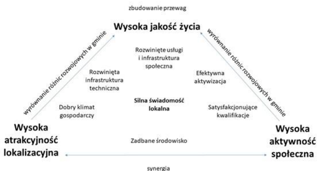
Rysunek 1. Układ celów strategicznych i operacyjnych