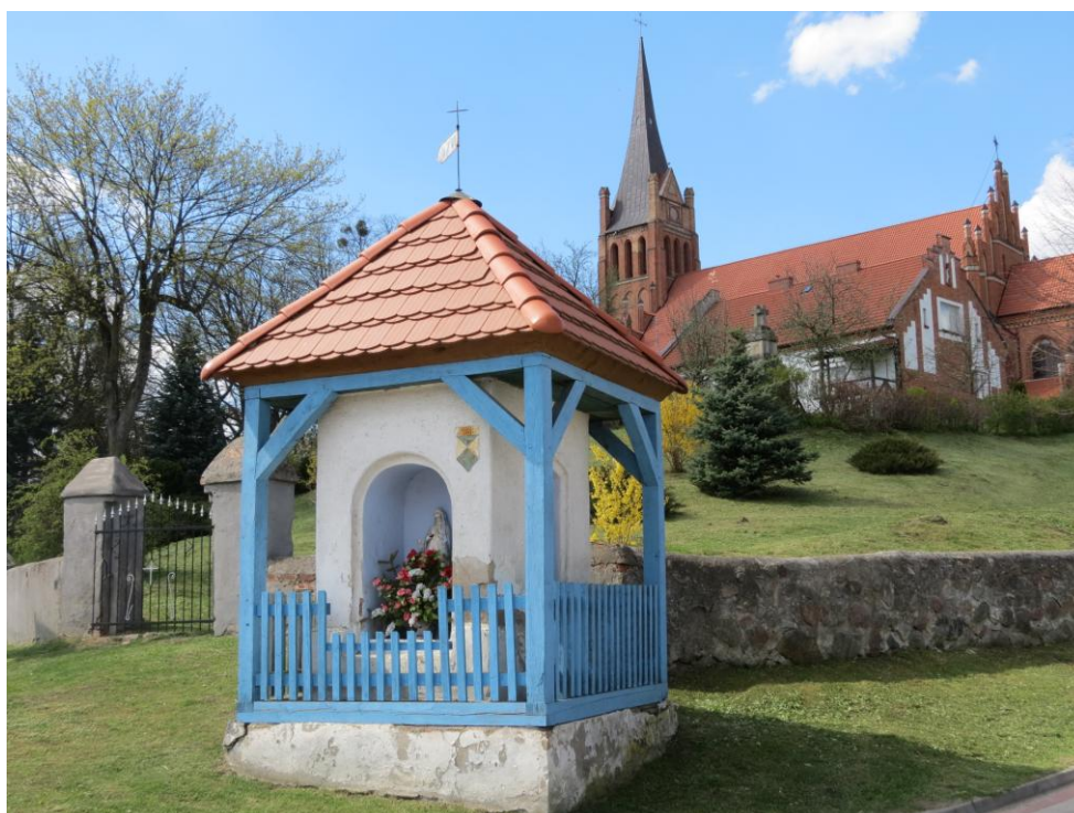
Brąswałd, kapliczka przydrożna z 1786 r.

dla mieszkańców wydarzeniach. Z uwagi na swoją architekturę stanowią niewątpliwe dzieła sztuki, a ludność wiejska nadal otacza je wielkim szacunkiem i opieką. Większość z nich pochodzi z przełomu XIX i XX wieku. Wiele z istniejących kapliczek wpisanych jest na listę zabytków i stanowią wspólne dziedzictwo kulturowe wszystkich mieszkańców Warmii. W ramach programu „Ratujmy warmińskie kapliczki” powstał pomysł, mający na celu, obok zapewnienia pracy dla miejscowej ludności przy renowacji kapliczek, obudzenie wśród Warmiaków przywiązania do miniaturowych obiektów sakralnych. Opieka nad kapliczkami dowodzi szacunku mieszkańców dla historii Warmii oraz wzrastającej świadomości i wrażliwości na dziedzictwo kulturowe.