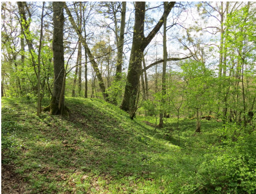
Wał grodziska w Barkwedzie.

działania inwestycyjne związane z budową i rozbudową współczesnej infrastruktury (systematyczne poszerzanie zabudowy zarówno w obrębie przestrzeni miejskich, jak też i wiejskich, budowa i modernizacja dróg, rozwój przemysłu i turystyki); coraz intensywniejszy i zakrojony na szeroką skalę proces poszukiwań amatorskich, często o charakterze komercyjnym i kolekcjonerskim, powodujący w wielu wypadkach całkowite zniszczenia stanowisk do tej pory niezagrażonych; coraz intensywniejsza eksploatacja surowców naturalnych (żwiru, piasku, itp.), w niektórych przypadkach przebiegająca w sposób nielegalny.