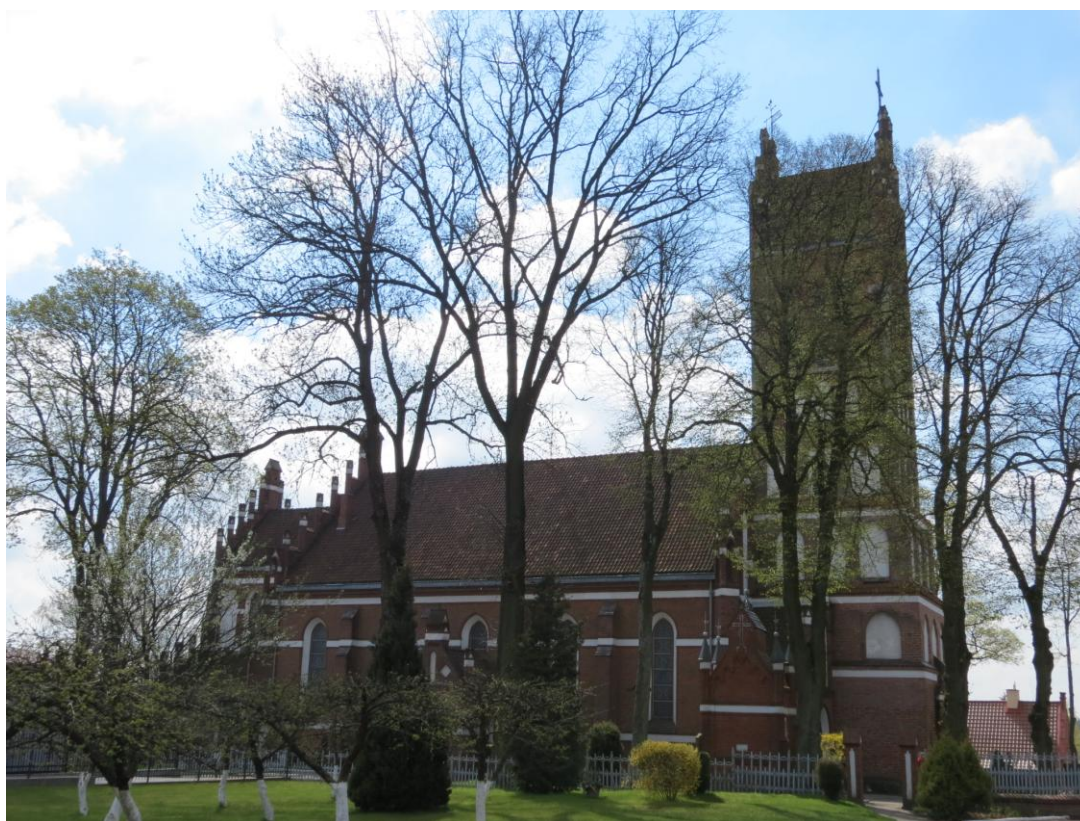
Kościół w Dywitach.

Pierwszą wzmiankę o Dywitach podaje dokument z 15 VII 1354 roku. Lokację Dywity otrzymały 5 X 1366r. z rąk Kapituły Warmińskiej, która równocześnie wyposażyła kościół parafialny. Pierwszy kościół gotycki poświęcony św. Apostołom Szymonowi i Tadeuszowi został wzniesiony prawdopodobnie jeszcze w XIV w. Wieża została postawiona na przełomie wieków XV i XVI. W 1893 rozebrano kościół pozostawiając wieżę. Wybudowano nowy i konsekrowano go 25 X 1897 r. Budowniczym nowego kościoła był ks. Józef Rapierski, który wyposażył także jego wnętrze. Neogotycki ołtarze, figury apostołów, konfesjonał i chór wykonały zakłady sznycerskie z Królewca. Szkoła wrocławska wykonała witraże, a szkoła śląska obrazy drogi krzyżowej i obrazy bocznych ołtarzy.