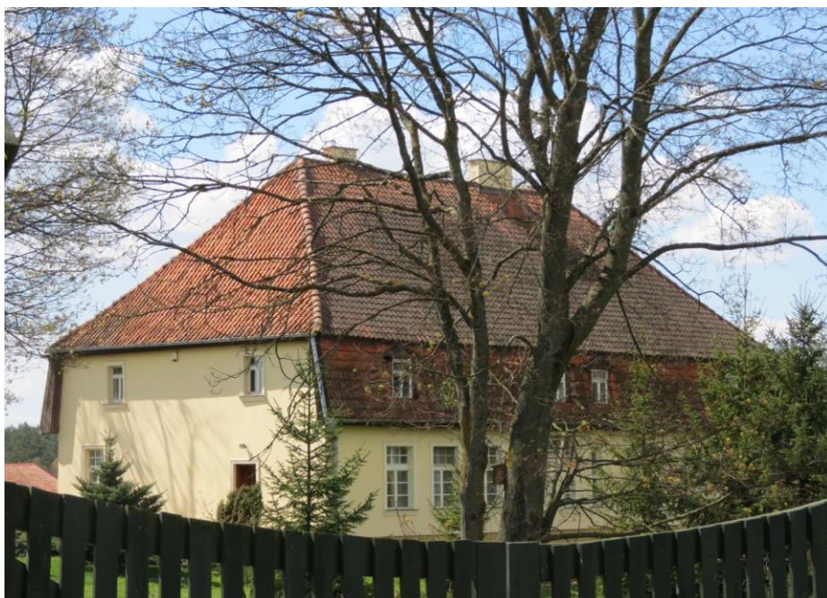
Spręcowo, dwór w zespole dworsko-folwarcznym.