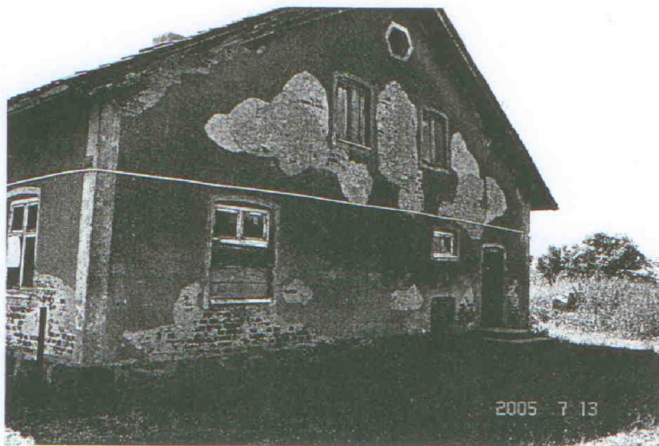
Stan istniejący świetlicy wiejskiej w Nowych Wiókach