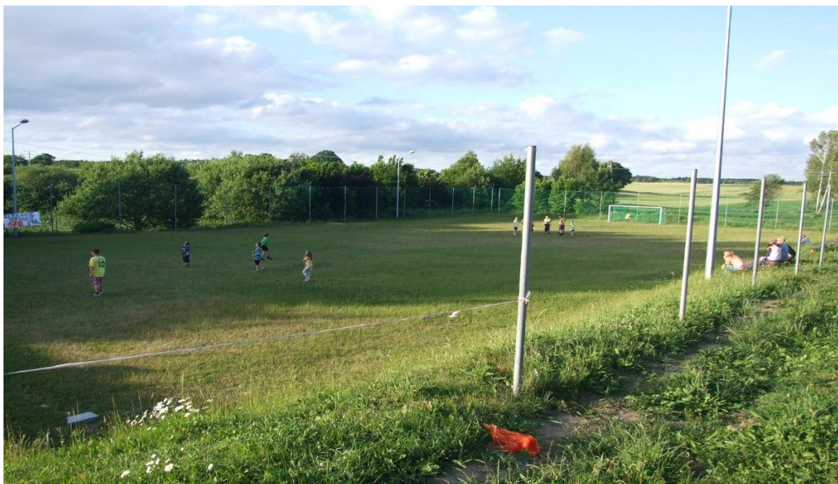
Plac sportowy- boisko do piłki nożnej.

Plac wiejski – boisko jest wykorzystywane również do organizacji imprez i spotkań mieszkańców.