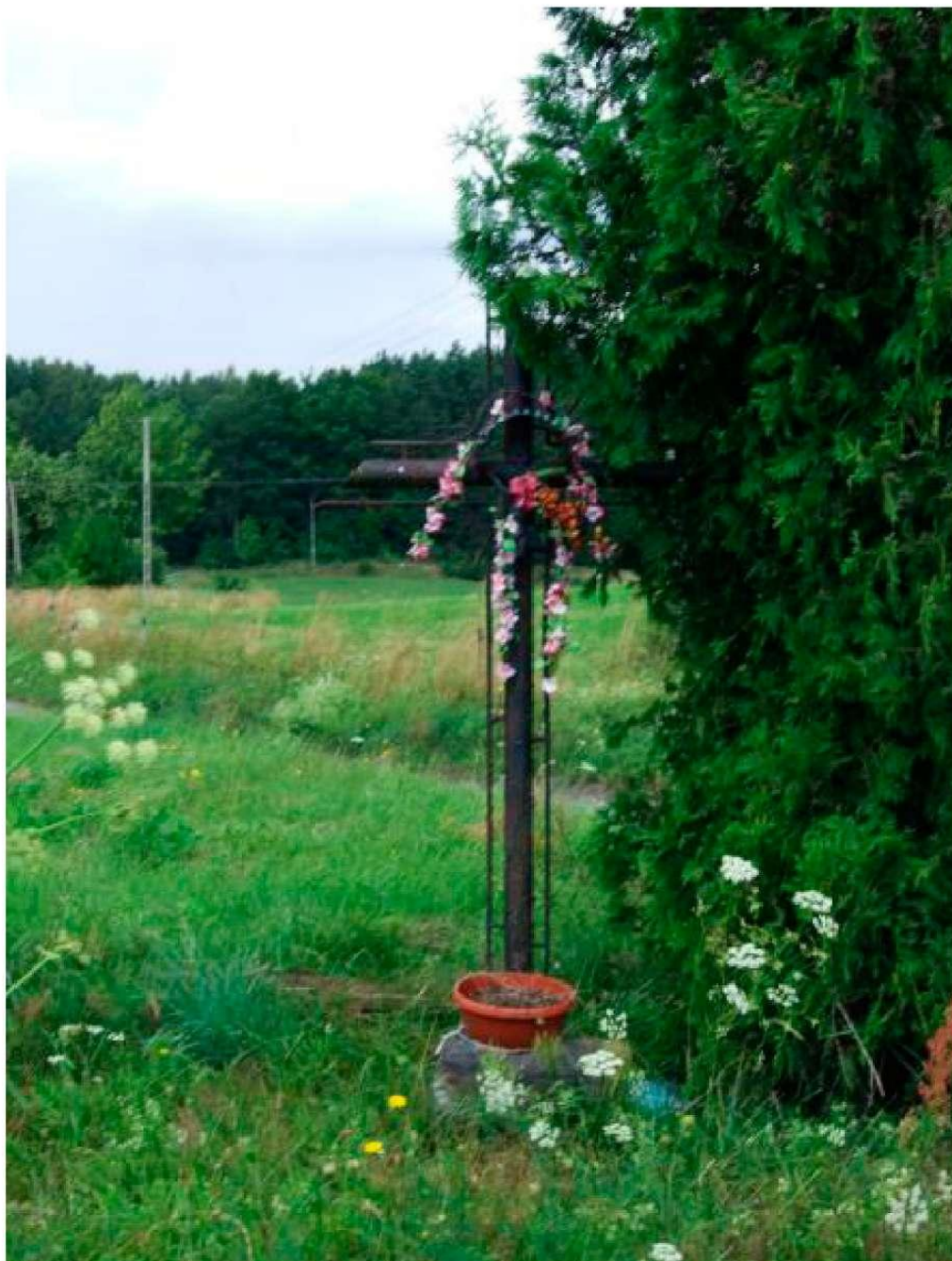
Jeden z przydrożnych krzyży