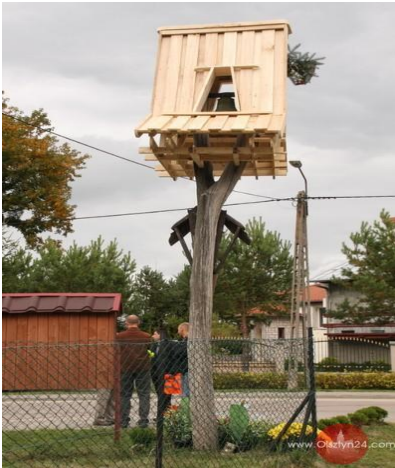
Dzwonnica z małym dzwonem przy wiacie dla dzieci oczekujących na autobus szkolny

W samym środku wsi znajduje się mały dzwon zawieszony na drewnianej dzwonnicy, który został postawiony przez mieszkańców 15 lat temu. Ze środków Funduszu Sołeckiego dzwonnica została zmodernizowana. Pochodzenie tego dzwonu jest nieznane, najprawdopodobniej stał on w tym miejscu jeszcze w czasach przedwojennych.