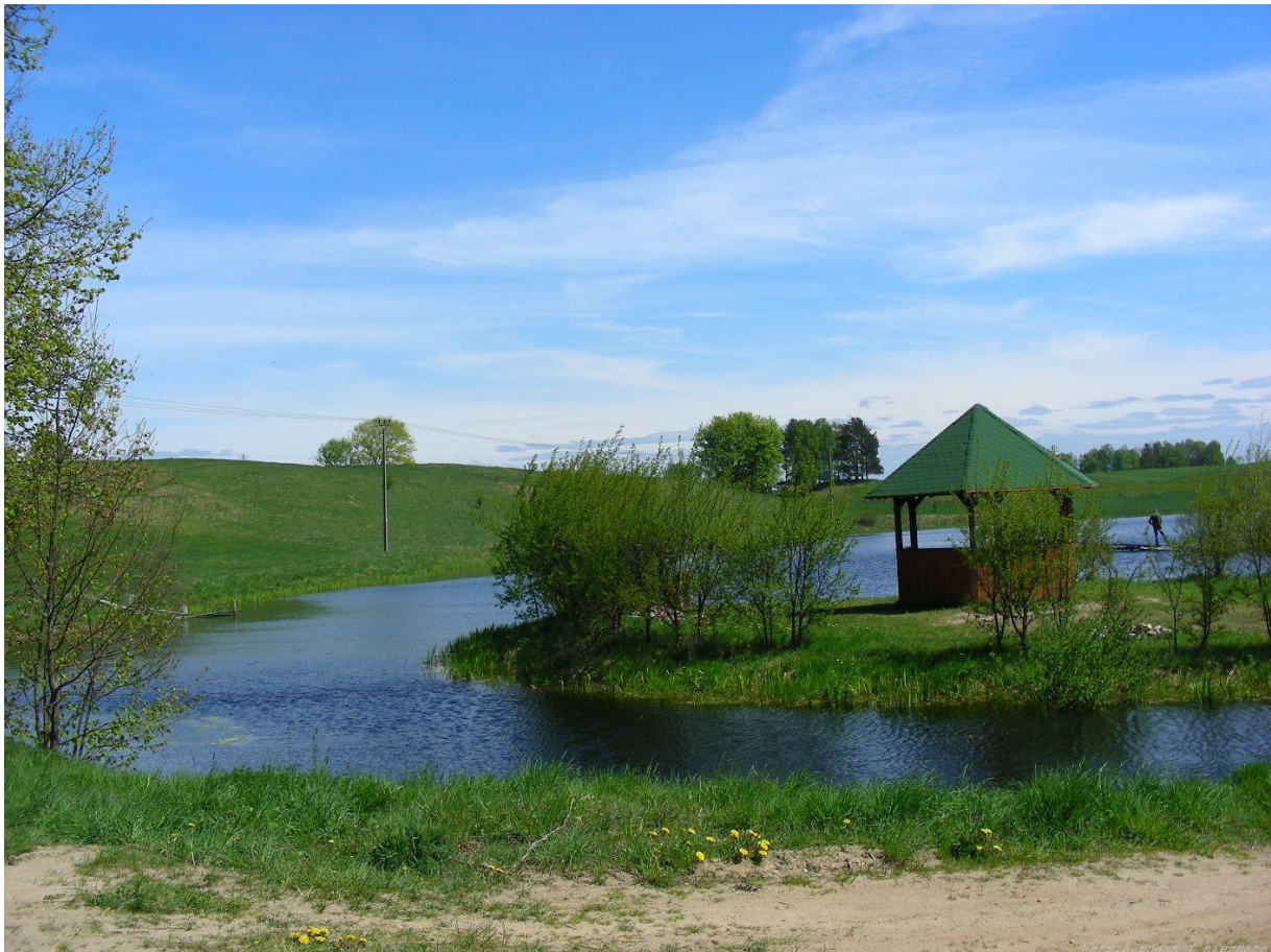
Jezioro Czark z widocznym miejscem wspólnych spotkań

W 2013 na terenie sołeckim przygotowano boisko do gry w piłkę nożną oraz boisko do gry w siatkówkę plażową. Nad jeziorem Czark od wielu lat Rada Sołecka przygotowywała teren do wspólnych spotkań mieszkańców. Jest wykonana wiata ze stołami i ławkami dla około 15 osób. Jest również miejsce na ognisko. W 2007 roku w ramach Stowarzyszenia "Warmiński Zakątek" przygotowano koncepcję zagospodarowania jeziora Czark celem utworzenia przestrzeni służącej zaspokajaniu potrzeb publicznych mieszkańców wsi Ługwałd z zakresu rekreacji, sportu i wypoczynku.